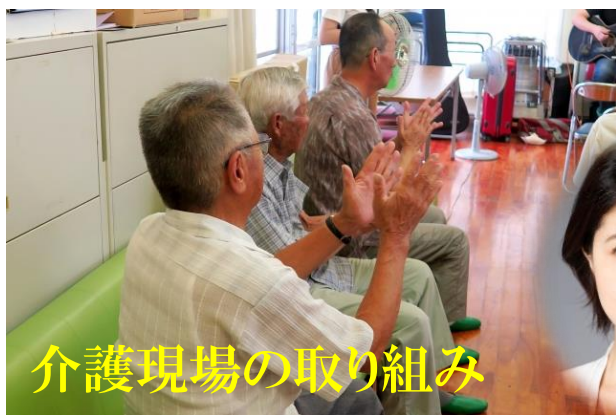
介護現場の取り組み